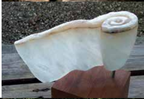
Links: "Opgerold" van Ilse Smulders