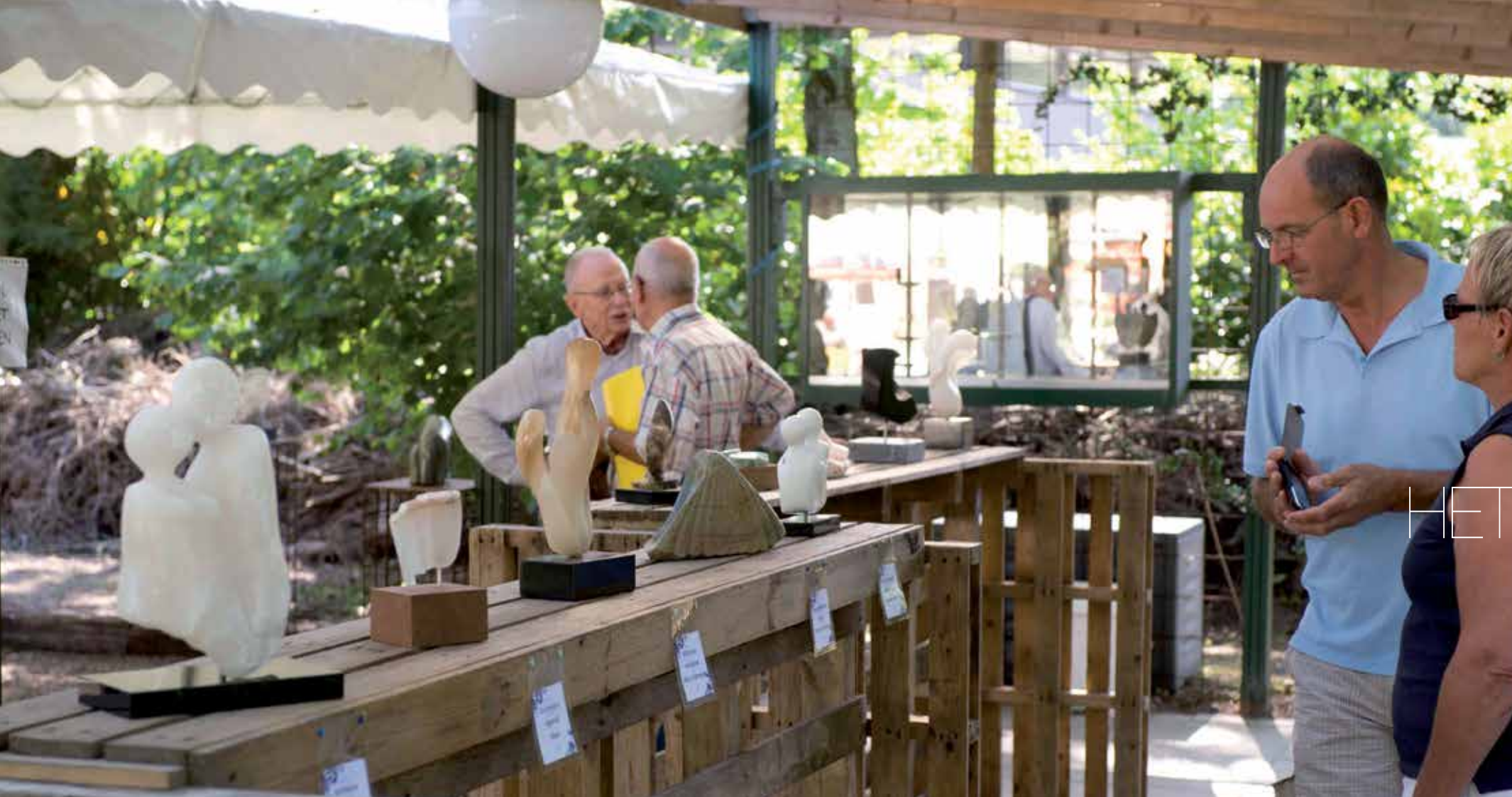
Kwetsbare albasten en hun bewonderaars vinden beschutting onder de overkapping.

TIJDENS DE JAARLIJKSE OPENDAGEN KAN IEDEREEN HET WERK BEKIJKEN